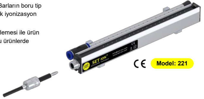
CE Model: 221