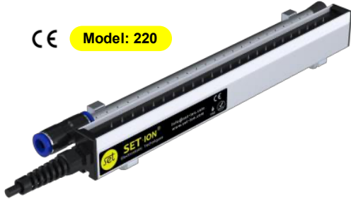
CE Model: 220

Uzun mesafe iyonizasyon yapmasının yanında havanın yayılarak ilerlemesi ile ürün üzerinde üç boyutlu iyonizasyon sağlar. Film şeklinde olmayan üç boyutlu ürünlerde ulaşılması zor bölgelere uzun mesafelerden kolayca ulaşabilir.